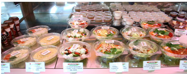
Aus unserer Verkaufstheke in Neuenhof - tägliche FRISCHE garantiert.....