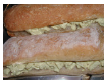
Chicken Curry Ciabatta