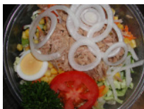
Thonsalat mit Zwiebeln